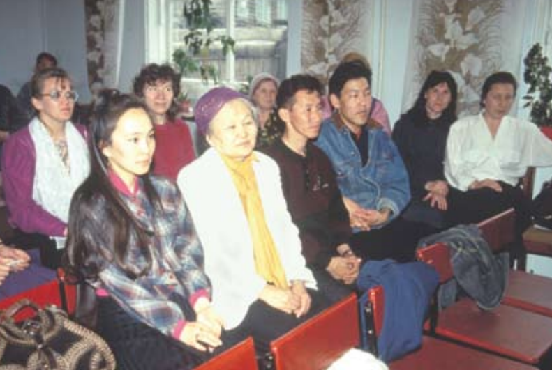
Eine kleine Gemeinde in Jakutien feiert ihren Gottesdienst