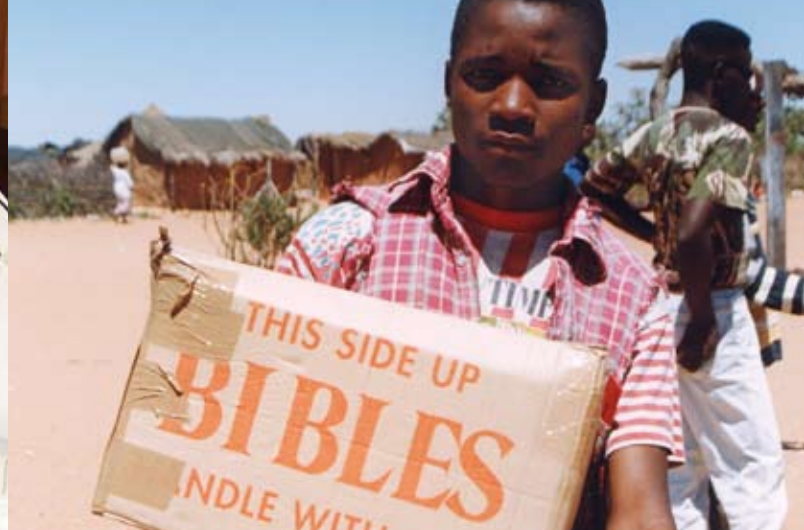
Bibelverbreitung in den Dörfern Namibias

Seit 2008 gibt es das Matthäus-Evangelium und es wurde mit großem Interesse aufgenommen. In Radiosendungen konnten die Hörer diskutieren, welche Redewendung in Khoekhoegowab dem biblischen Original am besten entspricht.