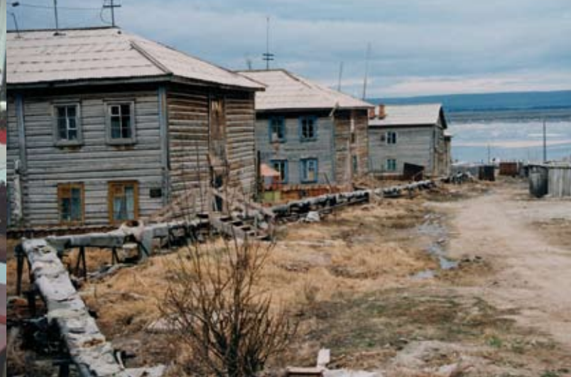
Typische Häuser in der kargen Landschaft Jakutiens