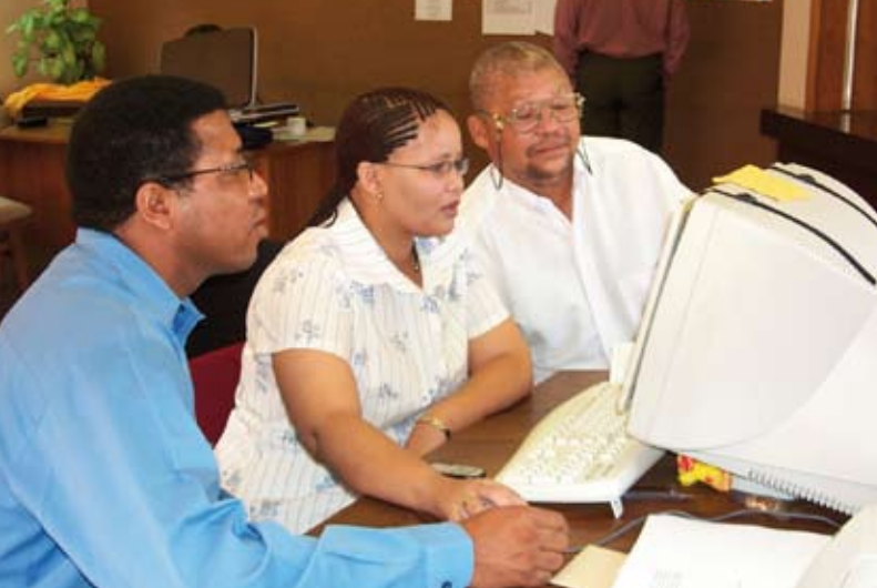
In Namibia wird intensiv an der Übersetzung in Khoekhoegowab gearbeitet