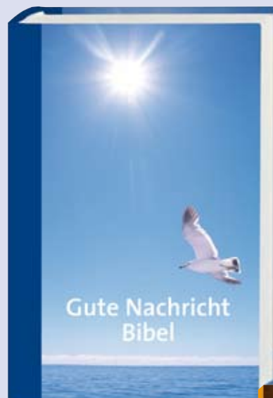
Motiv Möwe ISBN 978-3-438-01690-4

Innehalten, zur Ruhe kommen, offen werden für Gottes Wort: Diese beiden Bibelausgaben verbinden den modernen und zuverlässigen Text der Gute Nachricht Übersetzung mit einer frischen, ansprechenden Einbandgestaltung. Das macht sie zu idealen Begleitern bei Ihrer täglichen Stillen Zeit.